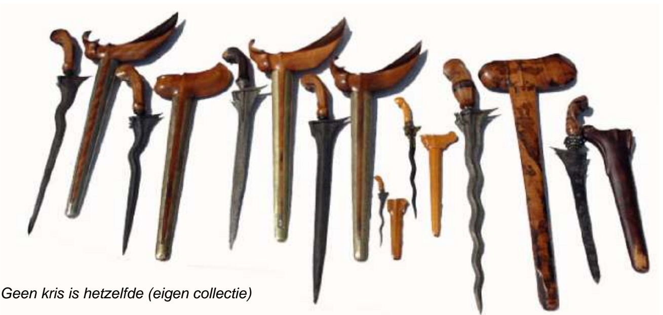
Geen kris is hetzelfde (eigen collectie)

Er zijn twee hoofdtypes te onderscheiden: dapur bener ; het rechte lemmet (ook wel de slang in ruste genoemd) en dapur luk (de bewegende slang), het gegolfd lemmet. Het aantal bochten in het lemmet is altijd oneven en kan van 3 tot meer dan 30 gaan. Het verschil in dapur is enorm. De onderzoeker Groneman vond op Java alleen al 40 typen dapur bener en 78 typen dapur luk.