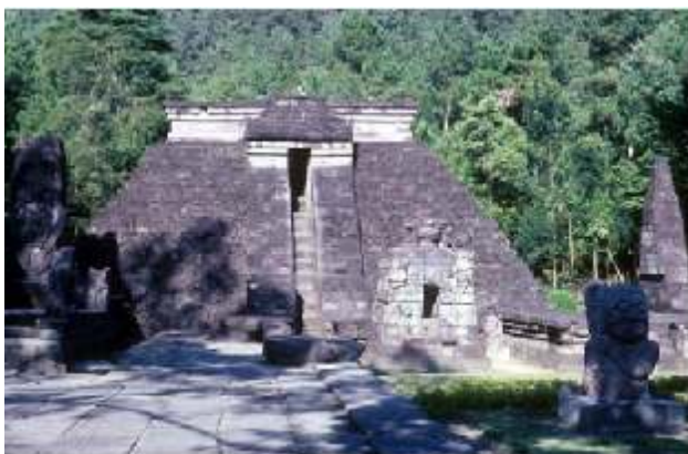
Candi Sukuh, midden Java

Al eeuwenlang zijn mensen gefascineerd door de kris. Niet alleen in Azië maar ook in het westen roept het wapen sterke reacties en zelfs emoties op. De eerste krissen in Europa zijn meegenomen tijdens de zoektochten naar specerijen die aan het eind van de 16e eeuw vanuit Spanje, Portugal en Nederland werden ondernomen. In 1624 beeldde Rembrandt al een Javaanse kris af op zijn schilderij 'Samson en Delila'. Deze kris was waarschijnlijk meegenomen door een VOC-dienaar uit Java. In de Indonesische archipel is de magische kracht die aan de kris wordt toegeschreven een onuitputtelijke bron van verhalen en belevenissen.