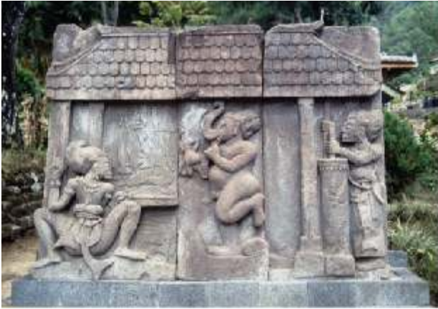
Relief te Candi Sukuh

Zoals ik al zei kent ook Solo een Kraton, in een binnentuin daarvan in een klein paviljoen of eigenlijk meer onder een afdakje ligt een, op het eerste gezicht, 60 tot 70 cm groot roestig blok steen, met wat altijd wel wat offerandes erbij.