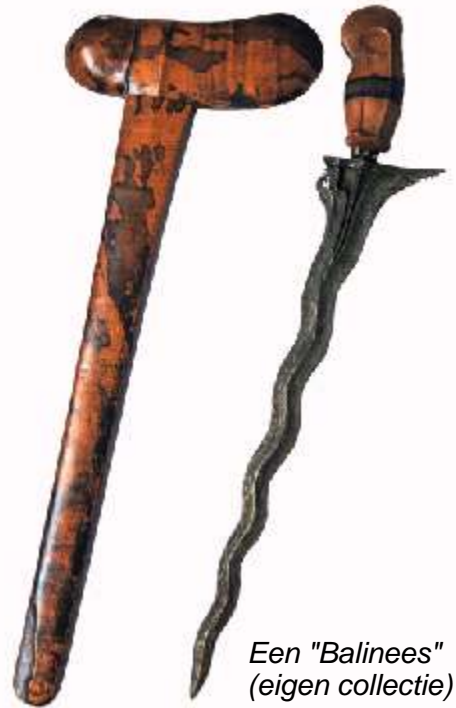
Een "Balinees" (eigen collectie)

Verder is de status van de kris binnen de Indonesische samenleving al een studie op zich. Ik beseft dan ook ik dat een keuze moet maken in de onderwerpen en wil me daarom in de eerste instantie beperken tot het "voorwerp" kris.