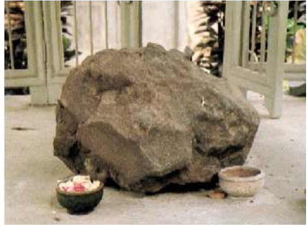
Prambananmeteroriet in Solo

machtige Javaanse vorstendom dat van 1294 tot 1527 grote delen van de Indonesische archipel overheerste. Er is niet veel bekend over deze tempel behalve dat het de enige piramide tempel is in Zuid-Oost Azië en grote gelijkenis vertoont met de Centraal-Amerikaanse Piramiden. We hebben in ieder geval een tijdstip en nu gaan we terug naar Solo voor het materiaal.